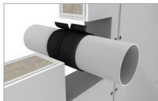
Návin okolo potrubia* z oboch strán stien, stanovte počet vrstiev