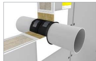
Označiť prestup štítkom Hensomastik Mixed Penetration