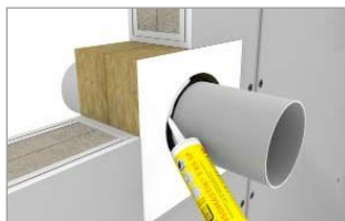
Zatmelit medzeru okolo potrubia s HENSOMASTIK 5KS SP