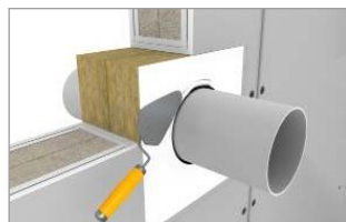
Zarovnať so špachtľou