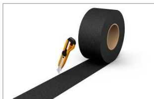
Odrezať pásku podľa požiadaviek