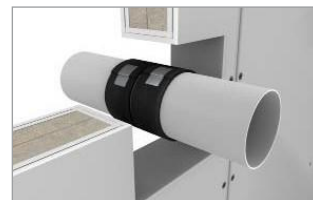
Zafixovať pásku lepiacou páskou, návin v rovine s povrchom steny