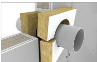
Inštalácia HENSOMASTIK Mixed Penetration Seal